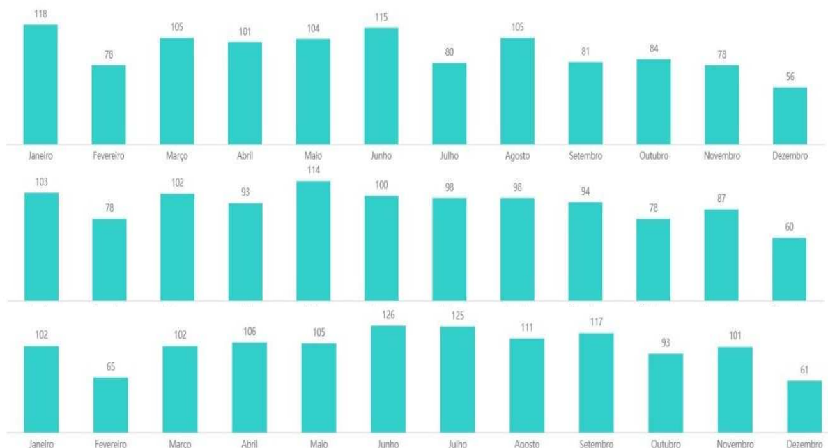
Gráfico 2 – Distribuição mensal de 2022, 2023 e 2024, respectivamente