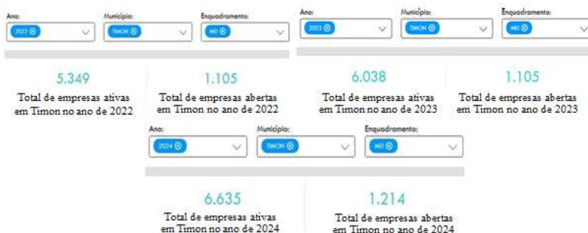
Gráfico 1 - Empresas abertas em Timon no ano de 2022, 2023 e 2024, respectivamente

A análise busca compreender o quantitativo de formalização de Microempreendedor Individual, identificar possíveis tendências de crescimento e discutir os fatores que podem ter influenciado essas variações. Para isso, os dados foram organizados em tabelas e gráficos, possibilitando uma visualização clara e comparativa entre os anos analisados.